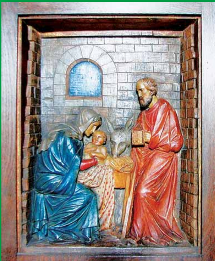
Sagebiel-Altar Zum Motto des Denkmaltages 2018: „Entdecken, was uns verbindet“