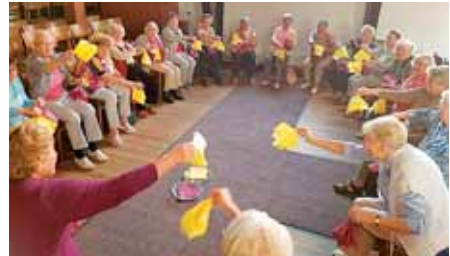
Fröhliche Runde beim Tanzen im Sitzen