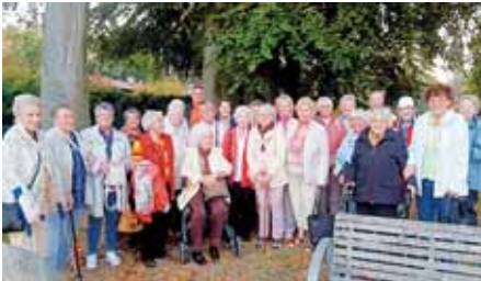
Unser Ausflug rund um die Müggelberge bei herrlichem Herbstwetter